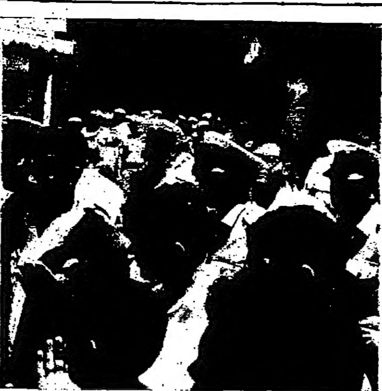
المظاهرة بقرآن الفاتحة على أرواح الشهداء يحيط بهم رجال الميريس الإسرائيلي